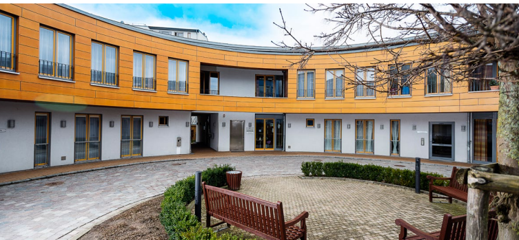
Das Zentrum Demenz Schwerin in der Gartenhöhe 6b

Augustenstift zu Schwerin (im Kirchsaal) Schäferstraße 17 19053 Schwerin